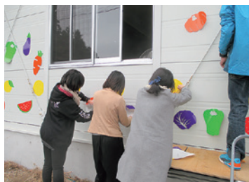
野菜の形決めをしている様子

産直で扱っている品物をリストアップし、その中から陸前高田市の特産である北限のゆずを中心に野菜を選びました。色は統一感を出すため、ゆずの黄色、トマトの赤、ナスの紫、キュウリの緑、ニンジンオレンジをイメージした5色に絞り