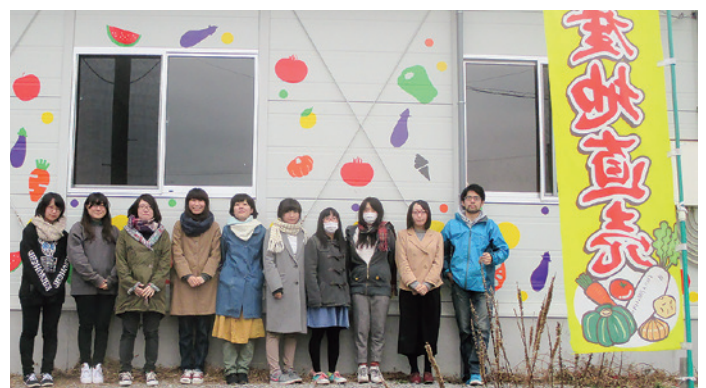
完成させた装飾とプロジェクトメンバー

また、皆様も陸前高田市を訪問する機会がありましたら、カラフルな野菜が目印な「陸前高田ふれあい市場」で地元の新鮮な野菜や果物を購入してはいかがでしょうか。