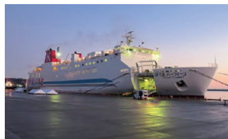
朝日を浴び出航を控えるシルバーQueen (宮古市産業支援センター港湾振興室提供)

ショートクルーズ乗船は公募で行いましたが、およそ1300名の応募があり市民のフェリー就航に対する