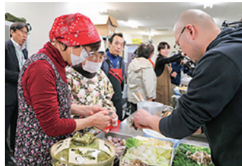
クエを湯通ししてから鍋に入れます