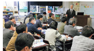
成果を発表した報告会

また、報告会に先立ち、研究成果パネル展示を行いました。森林から河口、そして沿岸域に及ぶ環境について、また、そこに生息する生物に関わる研究調査等、多くの研究課題の成果が3週間にわたり展示され、多くの市民に研究調査活動の成果を紹介することができました。