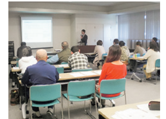
獣医師向けセミナー