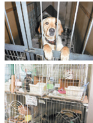
動物愛護団体での移動診療

震災から4年経過した今、支援ニーズも多様化していますが、被災動物支援班は今後も可能な限り支援を継続していきたいと考えています。